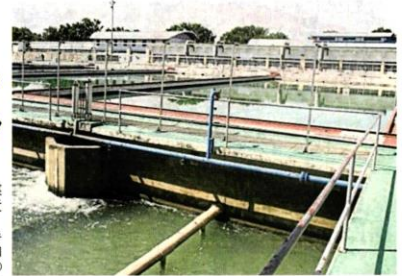
■士毛月河發現柴油氣味污染，以致士毛月河濾水站停止運作。(檔案照)

用戶也可聯絡“Air Selangor”手機應用程式、面字、Instagram和推特，或者聯絡雪州水供公司15300等，也可向 www.airselangor.com 或“Air Selangor”手機應用程式提出查詢或投訴。