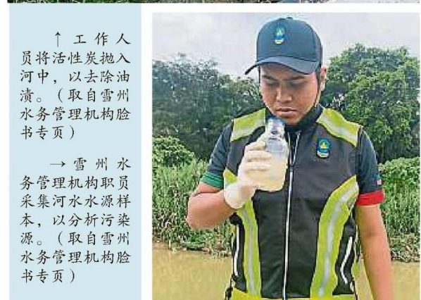
↑ 工作人员将活性炭抛入河中,以去除油渍。(取自雪州水务管理机构脸书专页)