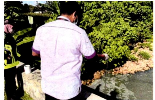
Anggota MPKJ dan JAS mengambil sampel air Sungai Rinching untuk dianalisis Jabatan Kimia.

Pengerusi Jawatankuasa Tetap Pelancongan dan Alam Sekitar,