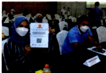
Antara peserta yang hadir menyertai program perintis anjuran anak syarikat Kerajaan Negeri Selangor ini.

"Usaha ini dilaksanakan supaya kontraktor di Selangor menjadi kontraktor berprestasi terbaik dalam pengurusan jalan termasuk mendedahkan mereka kepada teknologi terkini seperti contoh penggunaan SRAMS," tegasnya.