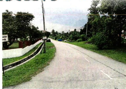
■加扎里路是甘榜双溪甘丹水患最严重地区。