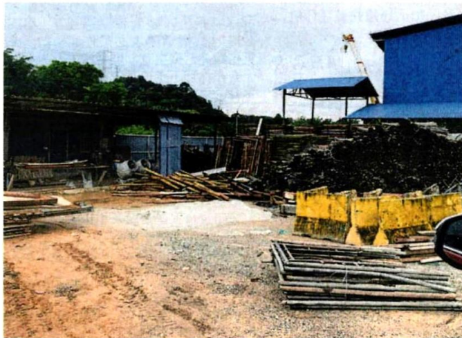
■ 重型车辆维修厂含有柴油油质的洗涤液体流入河流，引发士毛月河发生柴油气味污染课题。