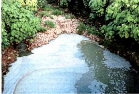
Foamy effluents found in Sungai Rinching on Tuesday.