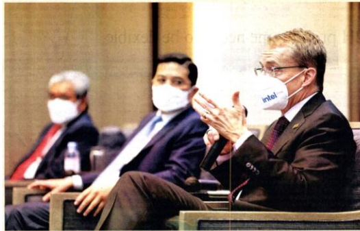
BUILDING RICH ECOSYSTEM: Intel Corp. CEO Patrick P. Gelsinger (right) with Senior Minister and International Trade and Industry Minister Datuk Seri Mohamed Azmin Ali (center) at a press conference yesterday. The US chip giant's US$29.5-billion (RM29.5b) new chip packaging and testing factory in Bayan Lepas, Penang, is expected to create over 4,000 Intel jobs and over 5,000 construction jobs. SEE P9