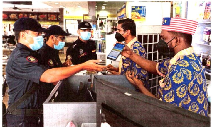
Anggota Penguatkuasa Majlis Perbandaran Klang memeriksa aplikasi MySejahtera pekerja di sebuah restoran di Bukit Tinggi bagi memastikan pematuan prosedur operasi standard (SOP) mencegah penularan COVID-19.

Pihak Berkuasa Kawalan Dadah (PBKD) Malaysia meluluskan vaksin Comirnaty keluaran Pfizer-BioNTech, vaksin CoronaVac keluaran Sinovac dan vaksin AstraZeneca untuk digunakan sebagai dos penggalak.