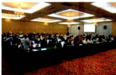
Kira-kira 60 peserta menyertai program anjuran Infracel Sdn. Bhd.