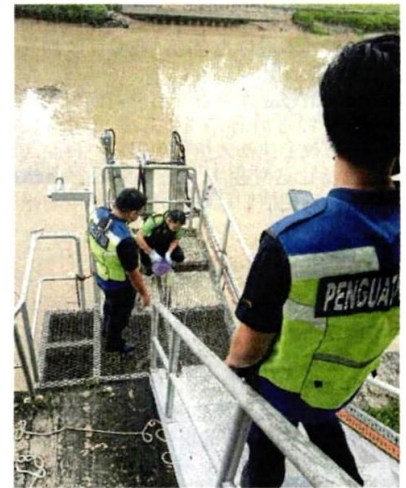
■ 执法人员在河流上抽取样本进行检查。

他说，该水供机构于下午2时在士毛月河的衔接处进行巡查，也每小时检查河水水质，发现河水正常，臭阈值 (TON) 处在0。