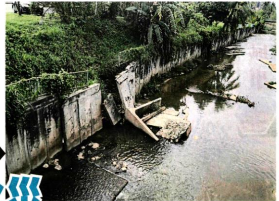
■美宝河预计在明年进行提升工程。