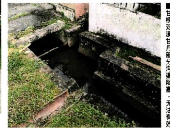
■排水。甘榜双溪甘丹部分沟渠阻塞，无法有效排水。

他说，甘榜的沟渠其实并不归市议会管理，而是属于土地局，但多年来当局疏于保养及提升。